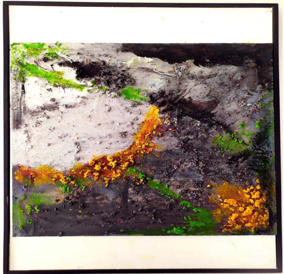
Título: La serie verde 1 y2. Técnica: Acrílicos sobre tabla. Medidas: 29x13 y 29x19 cm (serie de dos)