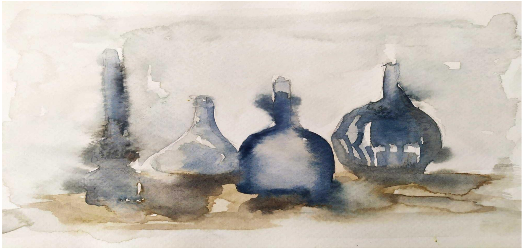
Título: El bodegón gris. Técnica: Acuarela. Medida: 27x17 cm.