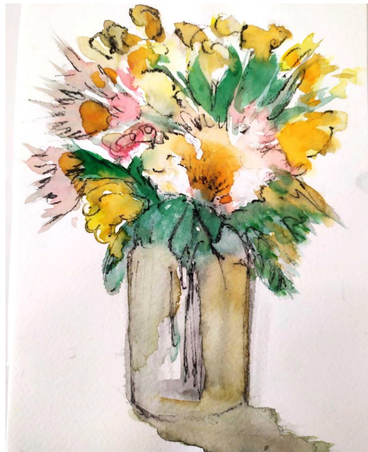
Título: Los vasos en flor 1 y2. Técnica: Acuarela y lápiz. Medidas: 27x18 cm (serie de dos)